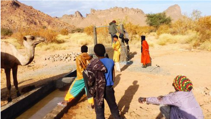
Document 2 : Tempête dans le sud de l'Algérie