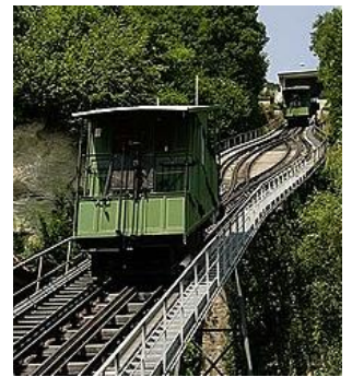
--- un funiculaire ---