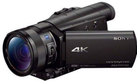
--- un caméscope ---