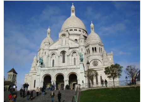
--- Montmartre ---