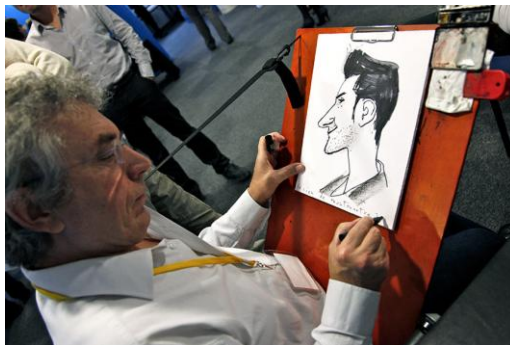
--- un caricaturiste ---