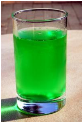
--- un diabolo menthe ---