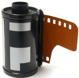
--- une pellicule ---

✦ Légende les images avec les mots du texte :