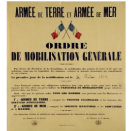
L'Allemagne déclare la guerre à la France