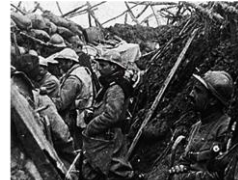
Bataille de Verdun