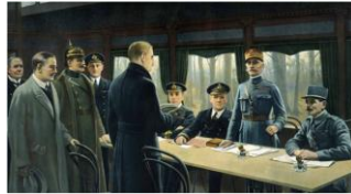
Signature de l'Armistice