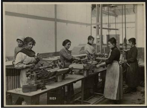
La fabrication de masques à gaz Michelin (1915)

👁️ Observe la photographie et 🗣️ réponds aux questions.