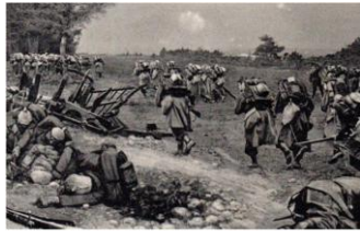
Bataille de la Marne

✳ Relie chaque image à la date de l'événement sur la frise.