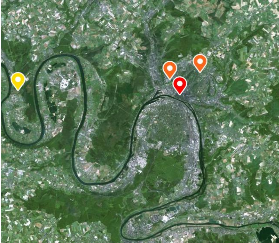
Aire urbaine de Rouen